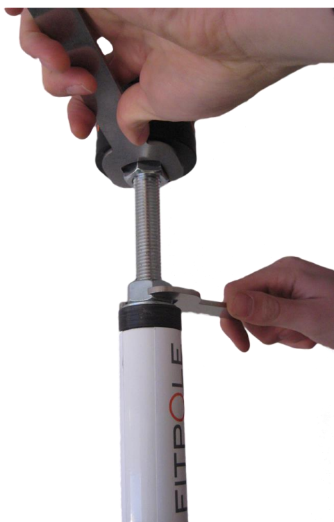
Kuva 7. Fitpolen asennus