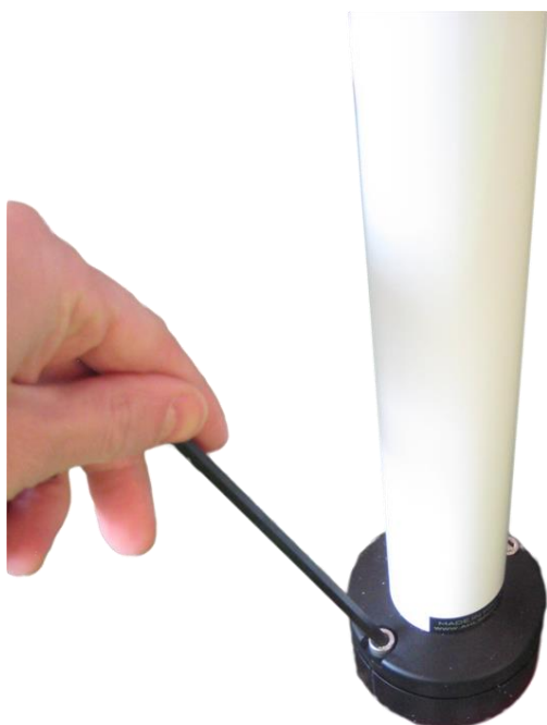
Kuva 8. Fitpolen mekanismi staattiseksi/pyöriväksi ( https://www.facebook.com/ahlsport/videos )

Pultteja ei saa kiristää liian tiukkaan. Riittää kun kiristät pultit kuusiokoloavaimella kuvan mukaisesti (kuva 8).