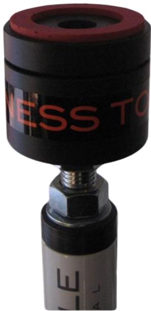
Kuva 4. Tiivisteiden asennus tangon yläpäähän

Mikäli et ole asentamassa Fitpolea kiinteään kattoon (esim. betonilaatta), on katto todennäköisemmin kipsilevyä. Levykatto on tuettu kannatinpalkkeilla. Tärkeintä turvallisuuden ja vahinkojen minimoimiseksi on että Fitpolen yläpää asennetaan kannatinpalkin kohdalle eikä niiden väliin (kuva 5). Kannatinpalkit voidaan löytää paikantajalla tai naputtelemalla. Kiinteä naputusääni indikoi kannatinpalkista ja ontompi ääni niiden välisestä kohdasta. Ole huolellinen ja kysy tarvittaessa apua rakennusalan ammattilaisilta, isännöitsijältä tai vuokranantajalta. Pidä mielessä että turvallisuus on tärkeintä! Käytä tukevia tikkaita ja pyydä toisen henkilön apua mm. tukemaan tikkaita.