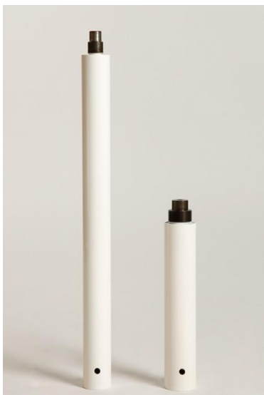
Kuva 9. Fitpolen 50cm/25cm jatko-osa

Jatko-osat kuvassa 9. Jatko-osa asennetaan pitkien tangon (ala- ja yläosa) osien väliin alla olevan kuvan 10. mukaisesti, mikäli käytetään useampaa jatko-osaa, niin tällöin jatko-osat laitetaan peräkkäin. Lopuksi kiristä tangon kyljessä oleva pidätinruuvi myötäpäivään mukana tulevalla kuusiokoloavaimella (kuva 3). Mikäli tarvitset erimittaisen jatko-osan, ota yhteyttä Ahlsporttiin.