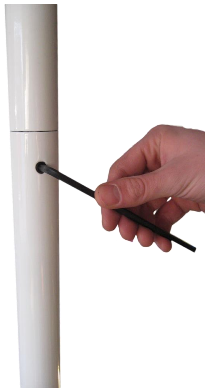
Kuva 2. Fitpolen kokoaminen