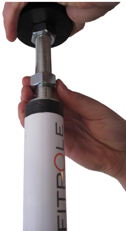
Kuva 6. Fitpolen yläosan kiristys- ja säätömekanismi

Nosta ensin yläosan muoviholkki kattoa vasten (kuva 6) ja pyöritä alempi mutteri (kuva 6) niin kireälle kuin käsin saat. Tangon saat kiristettyä katon ja lattian väliin kääntämällä alempaa mutteria (kuva 7) myötäpäivään. Ylemmällä avaimella pidät vastaan, että kiristysmekanismi ei pääse pyörimään (kuva 7).