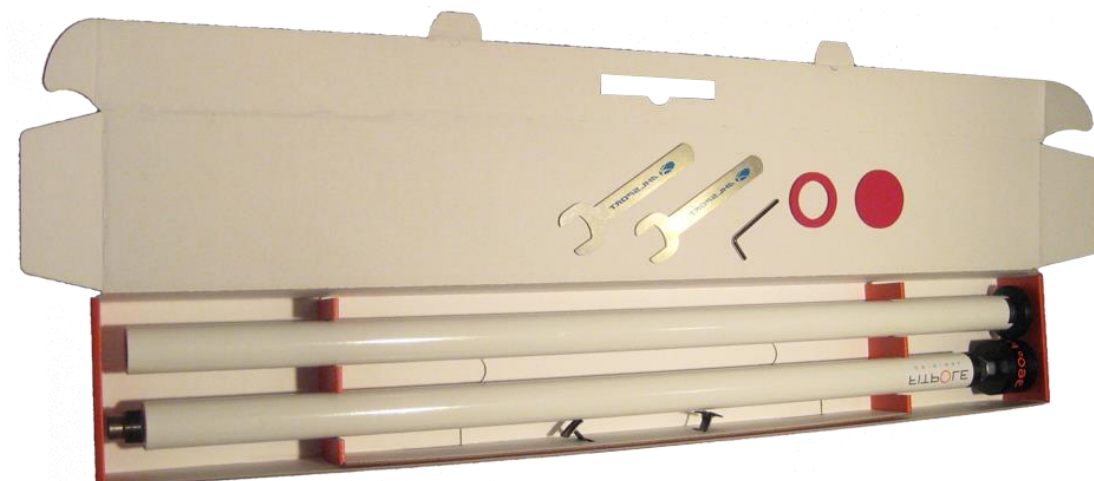
Kuva 1. Fitpole pakkaus sisältöineen

Jos pakkauksen sisältö ei ole kuvanmukainen tai mielestäsi jotain puuttuu, ota yhteyttä myyntipisteeseen. Huom. pakkauksen ulkonäkö voi erota kuvasta.